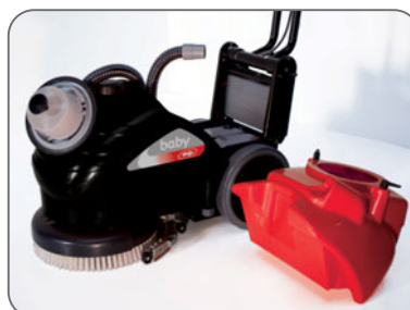
demontowalny zbiornik zanieczyszczeń ułatwia dostęp do baterii i wlewu zbiornika detergentów