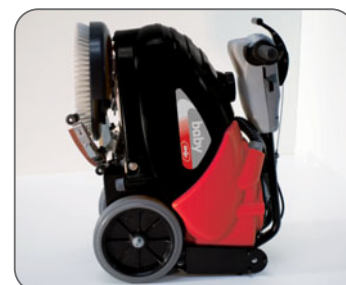
małe gabaryty i składana rączka ułatwiają transport i przechowywanie