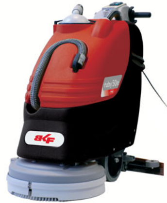
ruby 50 E