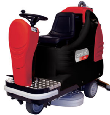
coral 65 BT coral 85 BT