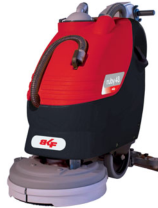
ruby 48 B