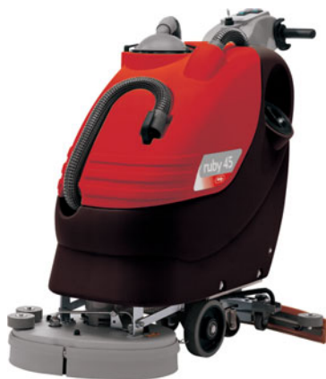
ruby 45 B light