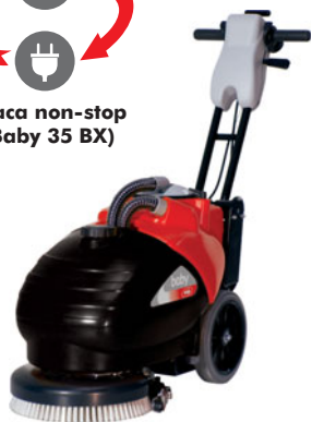
baby 35 B / BX