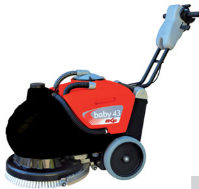
baby 43 B