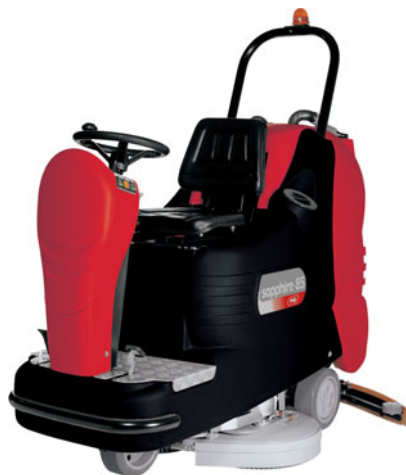
sapphire 65 BT sapphire 85 BT