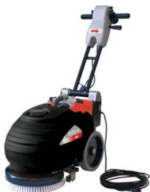
baby 35 E