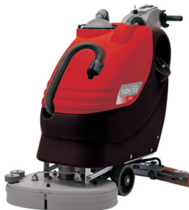
ruby 45 B / BT ruby 55 B / BT