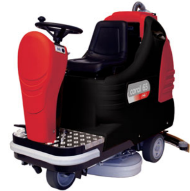
coral 65 M