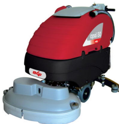
opal 66 BT opal 80 BT