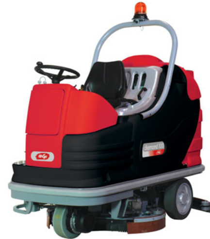
diamond 85 BT diamond 100 BT