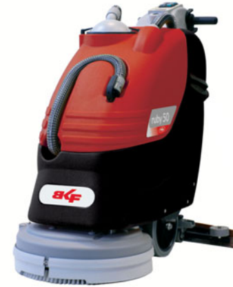
ruby 50 B / BT