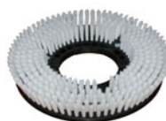
szczotka PPL nienasiąkliwa, wysoka odporność na ścieranie; grubość włosa 0,6-0,9 mm