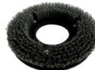
szczotka Tynex silnie zabrudzone podłogi twarde;