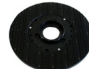
rzep do padów do pielęgnacji gładkich powierzchni;